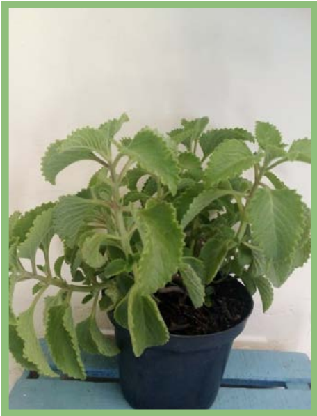
Orégano Cubano Precio: $ 25