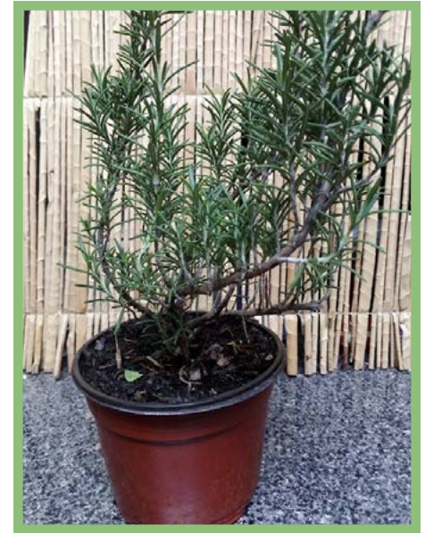
Romero Precio: $ 25