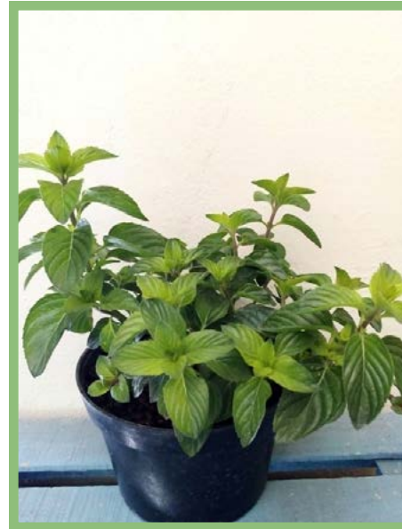
Menta Naranja Precio: $ 25