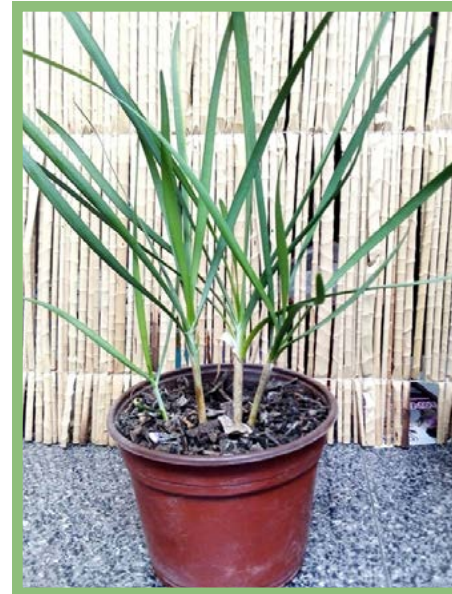
Cebollín Ajo Precio: $ 25