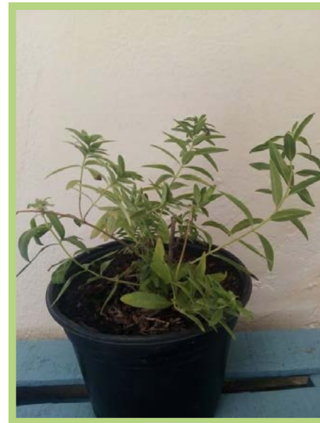
Cedrón Precio: $ 25