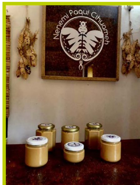
Crema de cacahuete natural 250 ml: $65 375 ml: $77