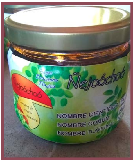
Conserva Modroño en adobo