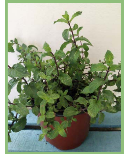
Menta Piperita Precio: $ 25