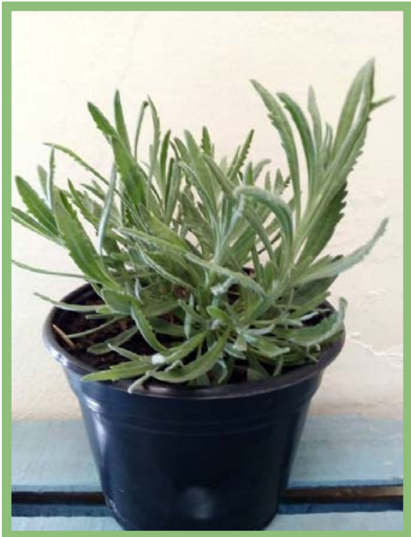
Lavandín Precio: $ 25