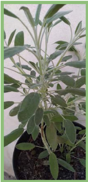
Salvia Officinalis Precio: $ 25