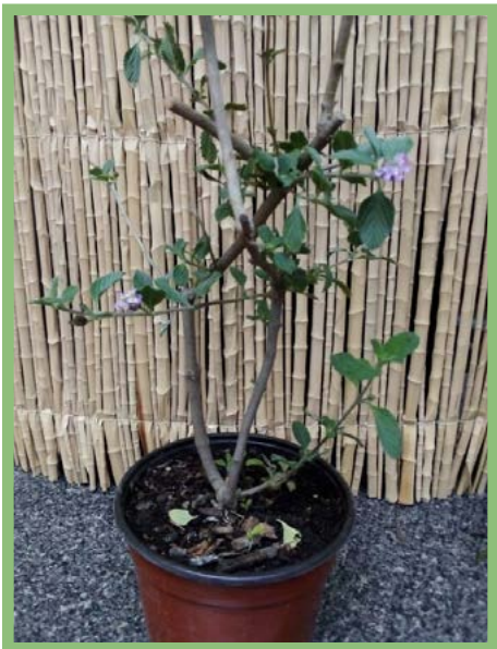
Terepe Precio: $ 25

Si necesitas menos, pregunta por el precio.