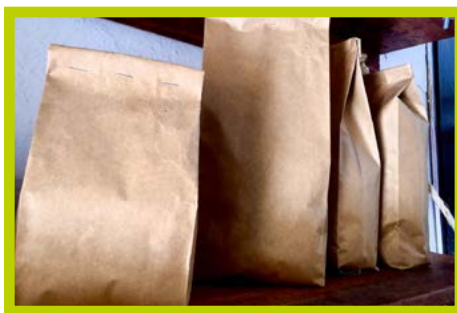
Café de los altos de Chiapas