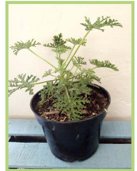
Citronela Precio: $ 25