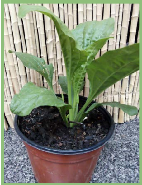
Llantén Precio: $ 25