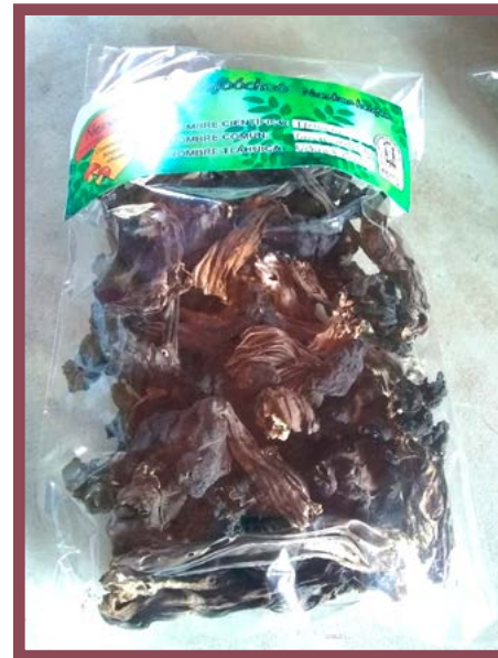
Hongo Gachupín Precio: $ 80