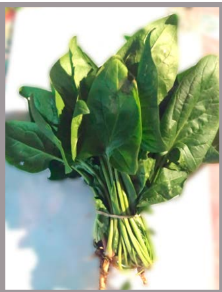
Espinaca Precio: $ 15