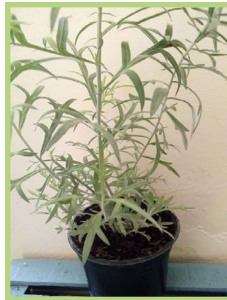
Iztafiate Precio: $ 25