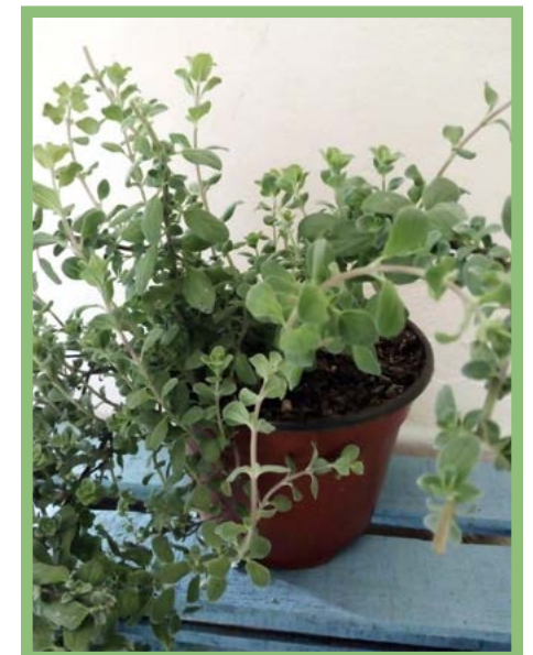
Orégano Mejorana Precio: $ 25