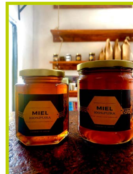
Miel de Hopelchén Cam. 375ml: $85 500ml: $115