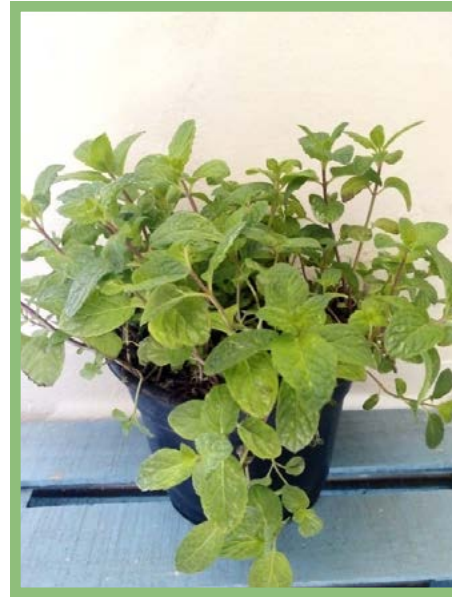
Hierbabuena China Precio: $ 25