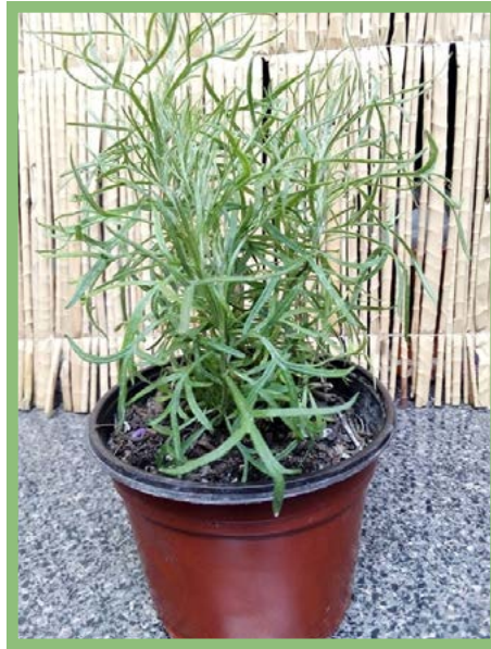
Estragón Precio: $ 25