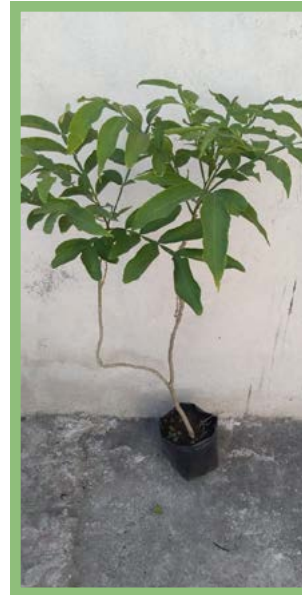
Jabonera Precio: $ 150