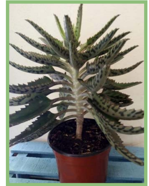
Kalanchoe Precio: $ 25