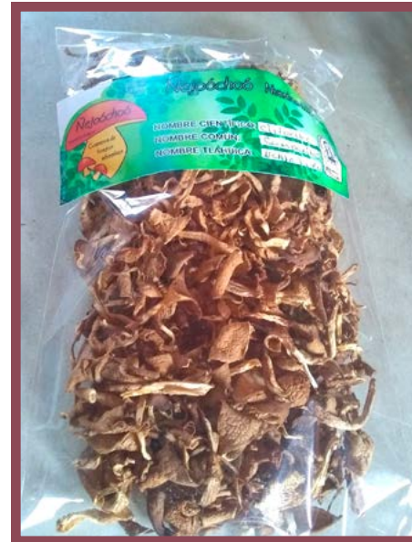
Hongo Campanitas Precio: $ 80