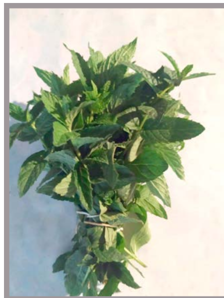
Hierbabuena Precio: $ 10