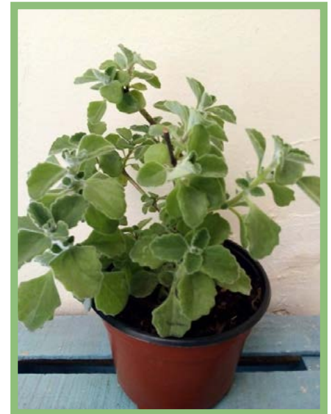
Vaporub Precio: $ 25