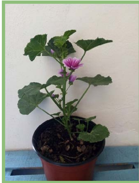
Malva Precio: $ 25