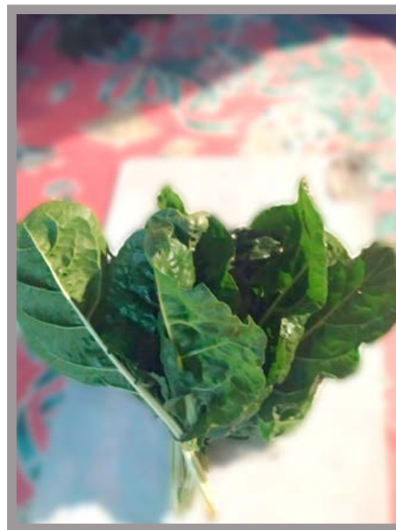
Acelga Precio: $ 10