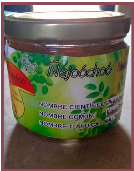
Conserva Gachupín en escabeche