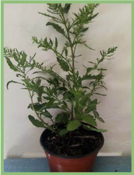
Epazote Precio: $ 25