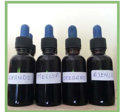
Extractos de plantas: Arandó, melisa, orégano, ajeno. Precio: $ 120