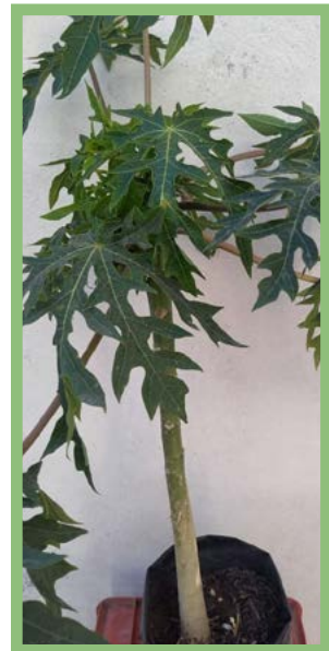
Papayo Precio: $ 50