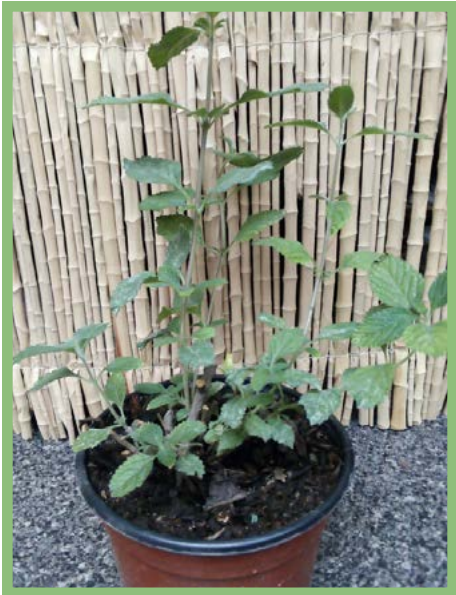
Verbena Precio: $ 25