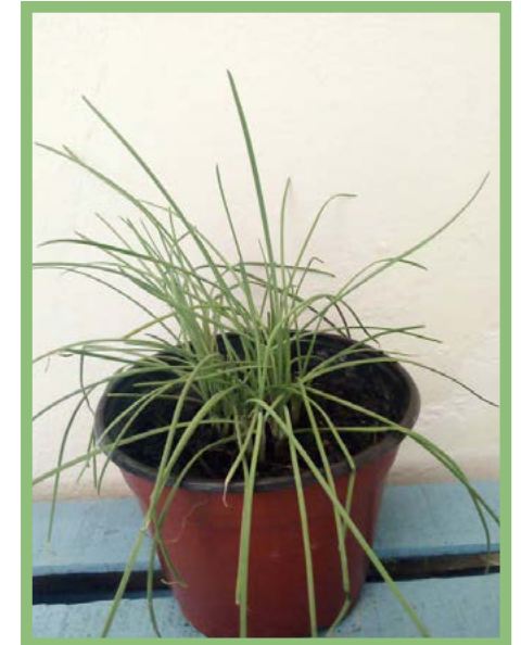
Cebollín Precio: $ 25