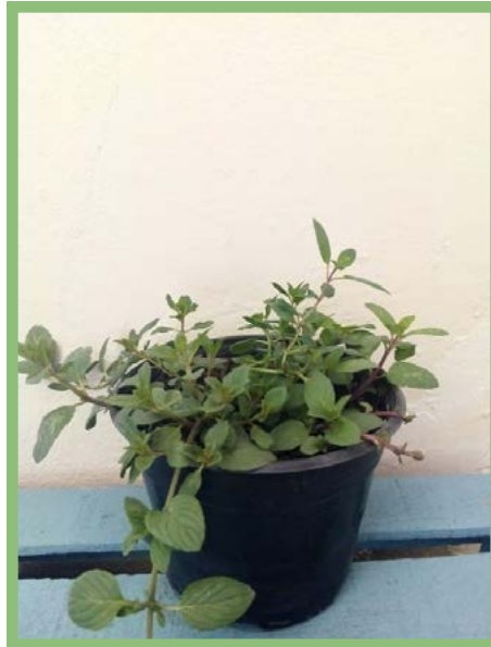
Menta Grande Precio: $ 25