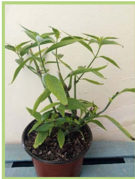
Hierbabuena China Precio: $ 25