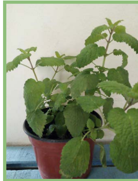
Melisa Precio: $ 25