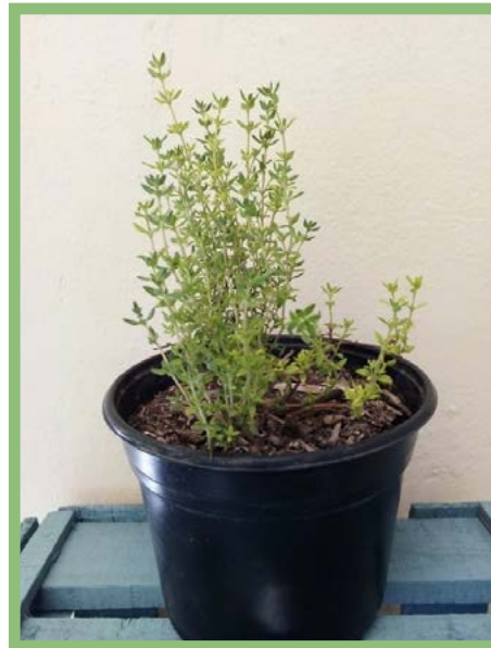
Tomillo Precio: $ 25