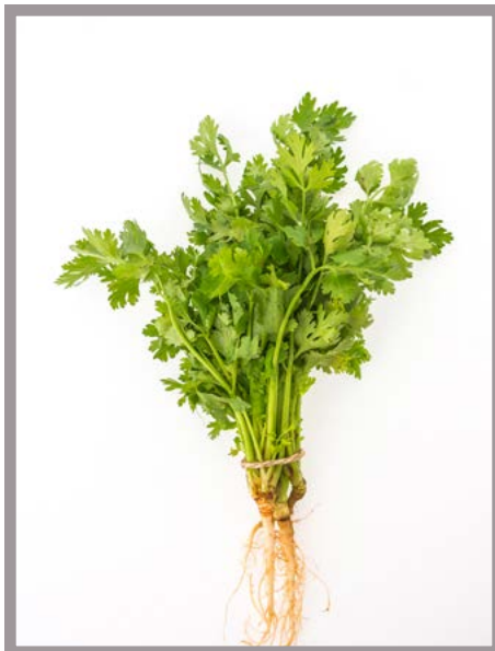
Cilantro Precio: $ 10