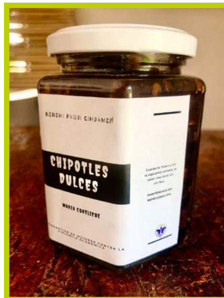
Chipotles dulces 375gr Precio: $ 70