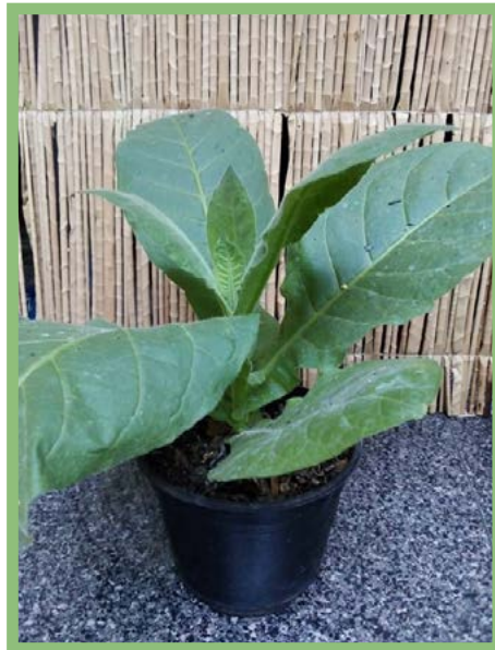
Tabaco Precio: $ 25