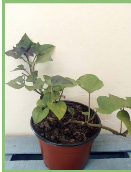
Camote Morado Precio: $ 25