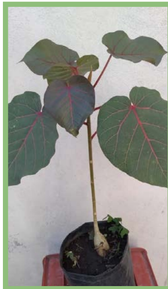
Amate Amarillo Precio: $ 200