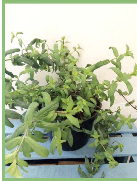
Poleo Precio: $ 25