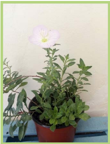
Hierbabuena Golpe Precio: $ 25