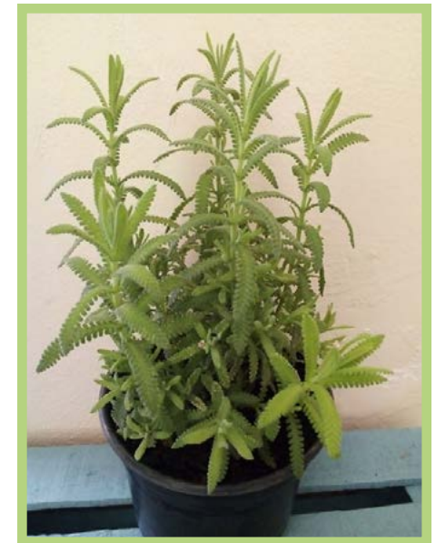
Lavanda Precio: $ 25