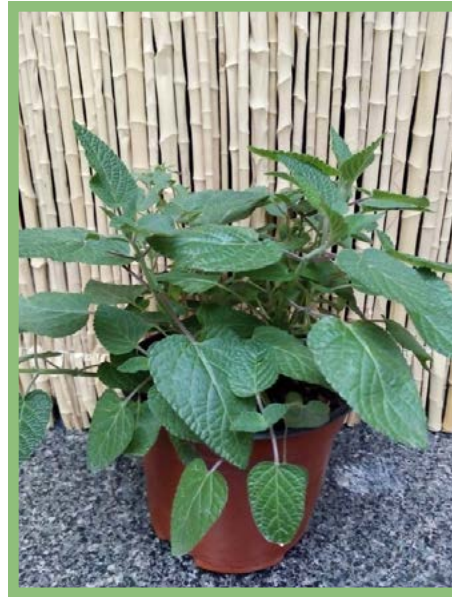
Prodigiosa Precio: $ 25