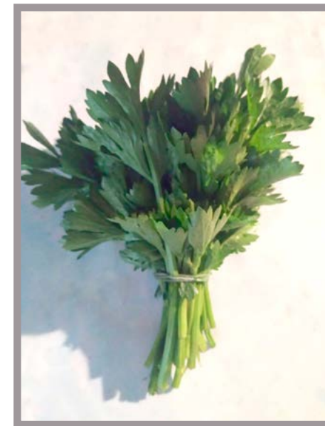
Perejil Precio: $ 10