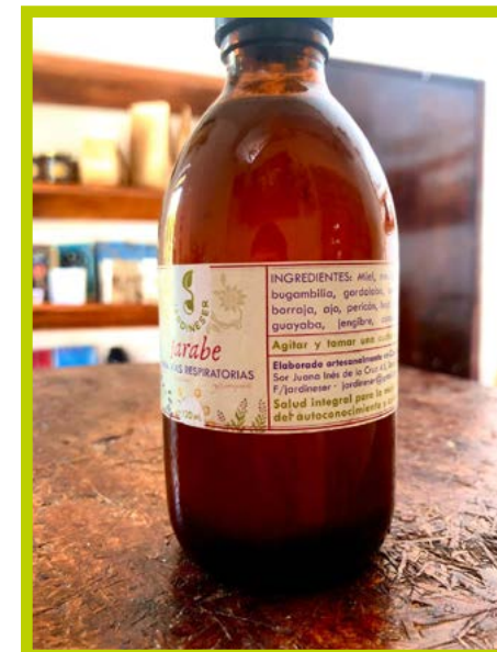
Jarabe vías respiratorias 120ml Precio: $ 120