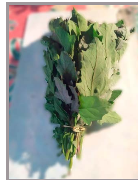
Quelite Precio: $ 10