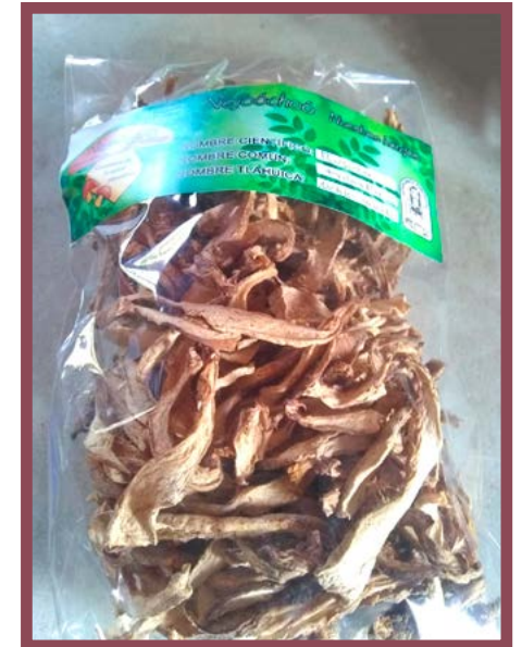
Hongo Trompa Precio: $ 80