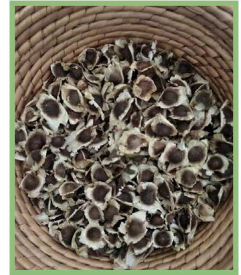
Semillas de Moringa Precio: $ 400 kg.

Si necesitas menos, pregunta por el precio.