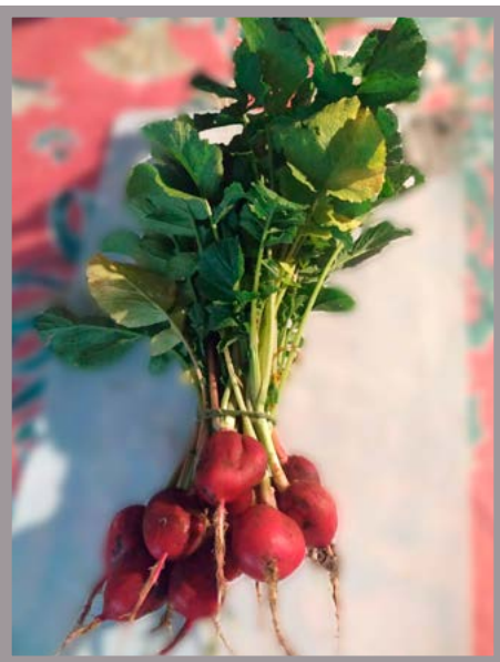
Rábano Precio: $ 10