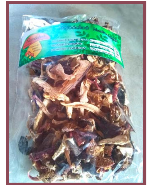
Hongo Modroño Precio: $ 80